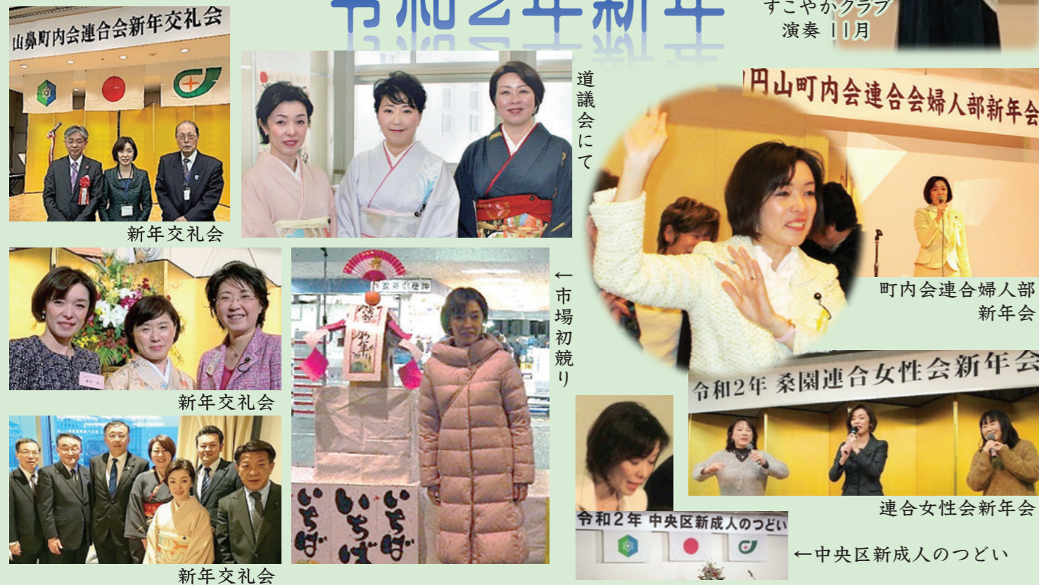
山鼻町内会連合会新年交礼会